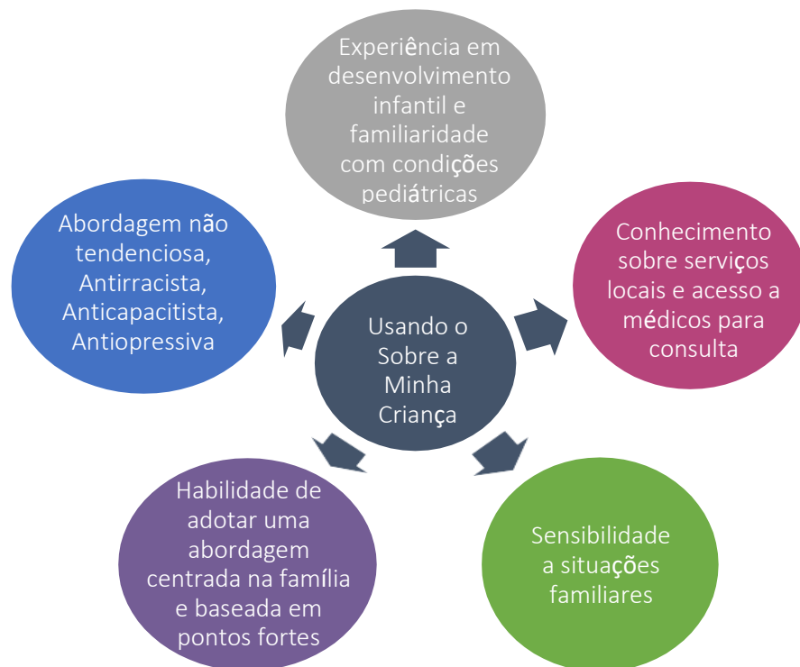
Figura 3: Conhecimentos e habilidades para administração de entrevistas com o Sobre a Minha Criança